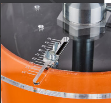
Vatdeksel met centrering