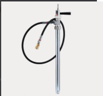
Pomp incl. slang met aansluitkoppeling