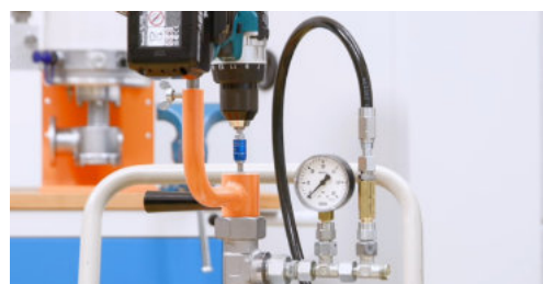
Overdrukbeveiliging incl. drukweergave